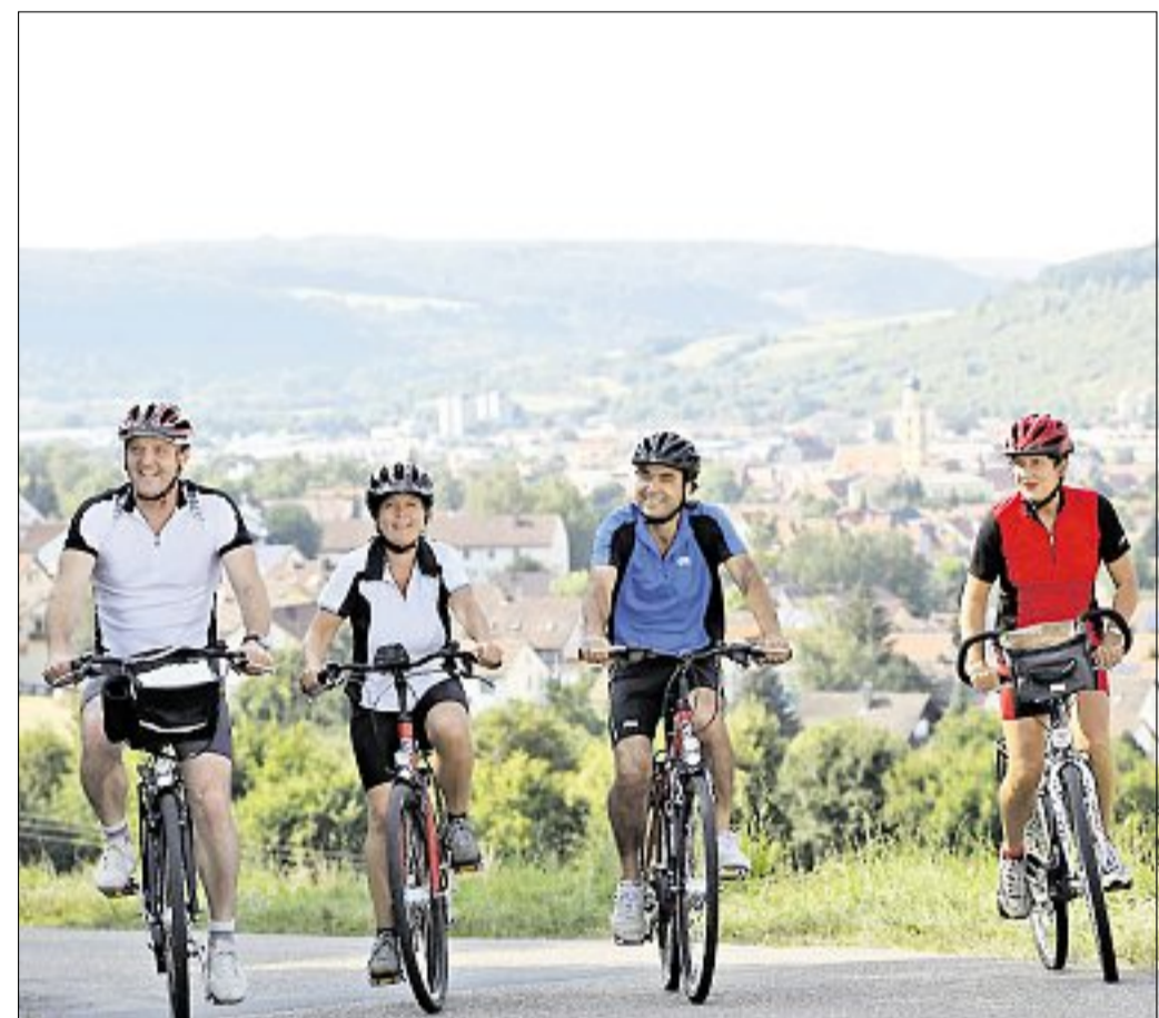
Mit dem Fahrrad in den schönsten Regionen Deutschlands auf Tour gehen – das ist für viele das totale Erlebnis.

Für interessierte Radfahrer gibt es nähere Auskünfte über die Radregion Nördliches Baden-Württemberg unter der Rufnummer 0 71 31/994 13 90 oder unter www.facebook.com/RadregionBadenWuerttemberg .